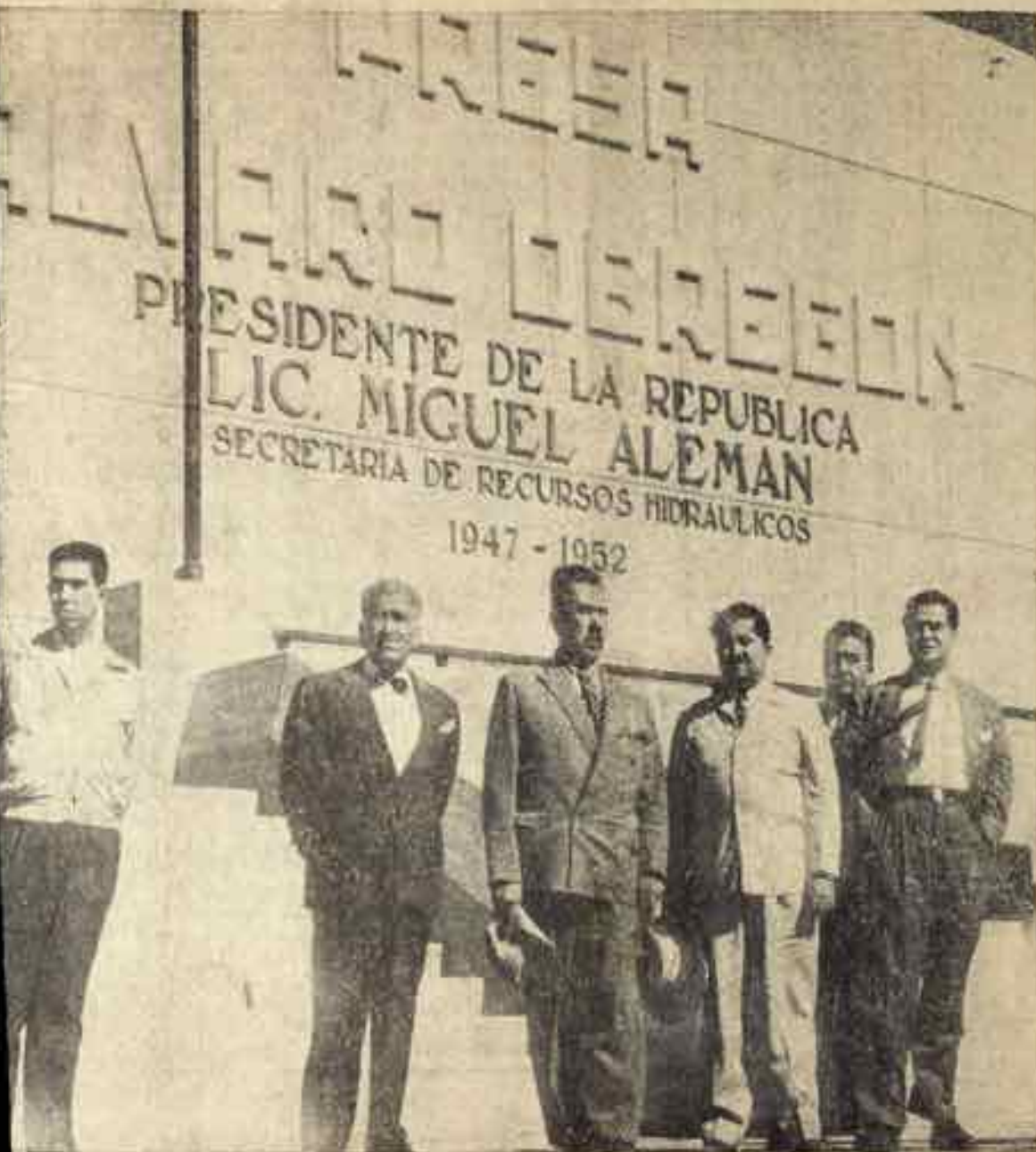
DIARIO DEL YAQUI fue el único periódico que en esta jornada de Cárdenas a Sonora y así lo anunció el día 7. Y Cárdenas vino como el Padre Basilio, aunque atando de Jovita; vino también a rodearlos y dar con ellos la primera vez. Hoy solo como barbaquea. En la gráfica se le ve con el Gobernador Obregón y monumento de la zona del cerro del Oviáchic, que