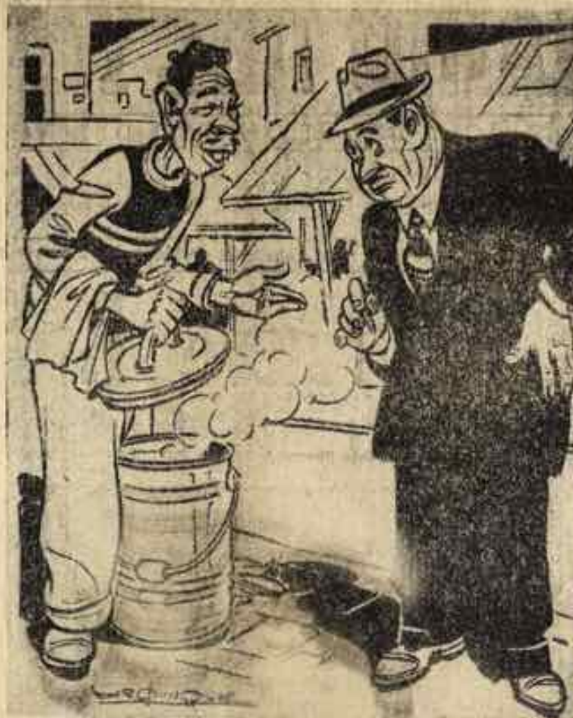
—¿Y por qué sus tamales se llaman "estilo policía" ...? —Pos que no ve, jefecito que la Policía esTA—MAL....